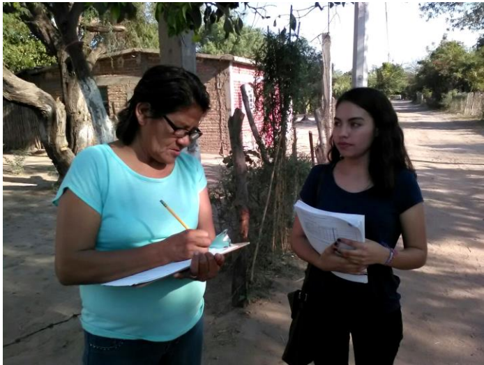
Aplicación de diagnósticos comunitarios en Macochín, Etchojoa. 2017