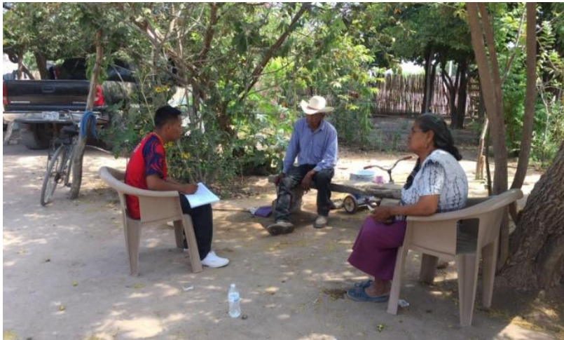
Entrevista de diagnóstico socioeconómico familiar. 2017