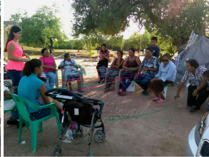
Sesión de identidad comunitaria. Tesotahueca, Navojoa. 2017