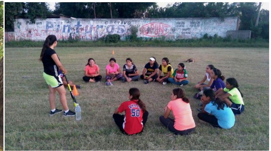
Sesiones iniciales de entrenamiento con equipo de softball femenino de San Ignacio Cohuirimpo, Navajoa. 2017