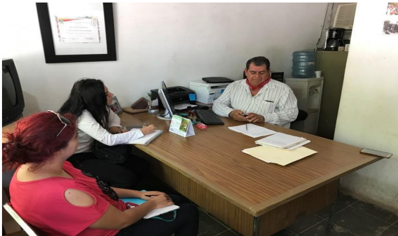
Alumnos de PE de LAET haciendo investigación para tesis. 2017